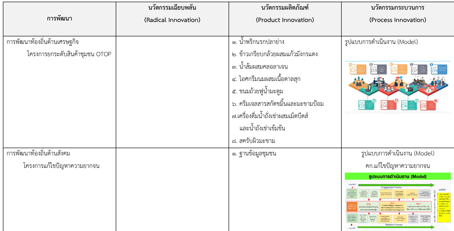
ตารางที่ ๑๘ : สรุปนวัตกรรมชุมชนภายใต้ยุทธศาสตร์มหาวิทยาลัยราชภัฏเพื่อการพัฒนาท้องถิ่น ประจำปี ๒๕๖๒