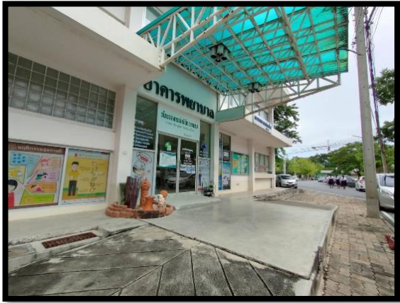
บริเวณด้านหน้าวไลยอลงกรณ์คลินิกเวชกรรม อาคารพยาบาล ชั้น ๑