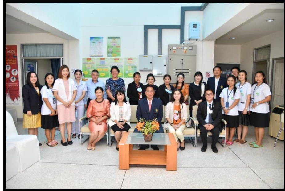
พิธีเปิดวไลยอลงกรณ์คลินิกเวชกรรม วันที่ ๑ ตุลาคม ๒๕๖๓