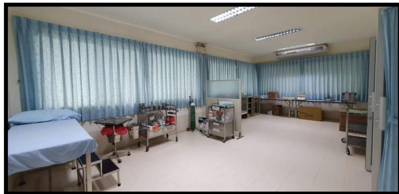
สภาพภายในวไลยอลงกรณ์คลินิกเวชกรรม