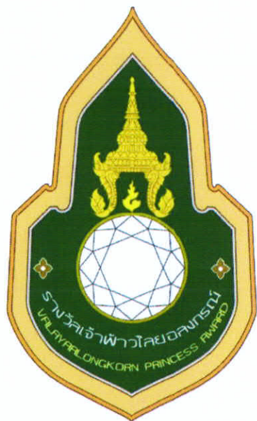
รูปเพชรตัดแบบมองจากด้านหลัง

การประกวดบุคคลต้นแบบ มหาวิทยาลัยราชภัฏวไลยอลงกรณ์ ในพระบรมราชูปถัมภ์ (รูปแบบที่ ก.3)