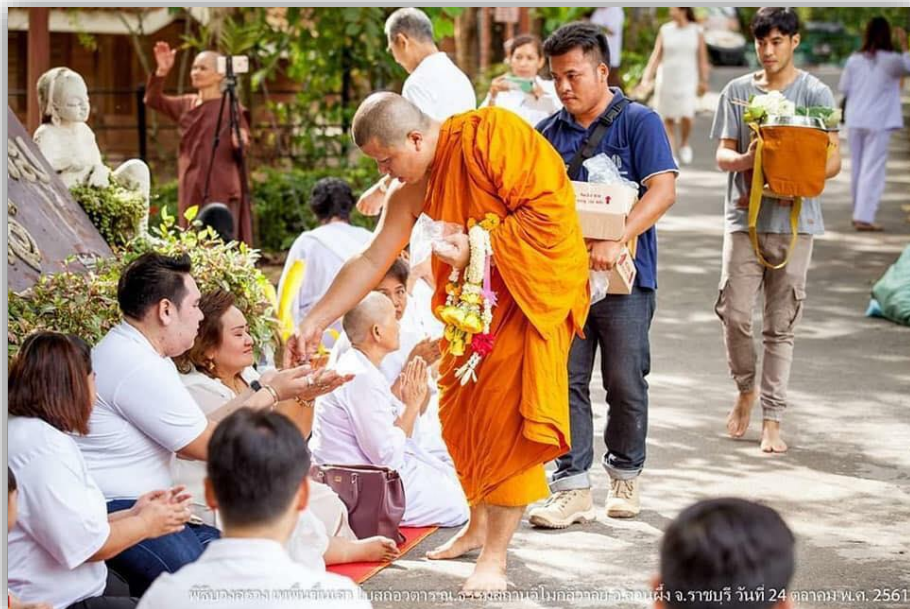
(พระญาณวิกรม ออกรับศรัทธาญาติโยมอย่างทั่วถึง และเท่าเทียมกันทุกคน)