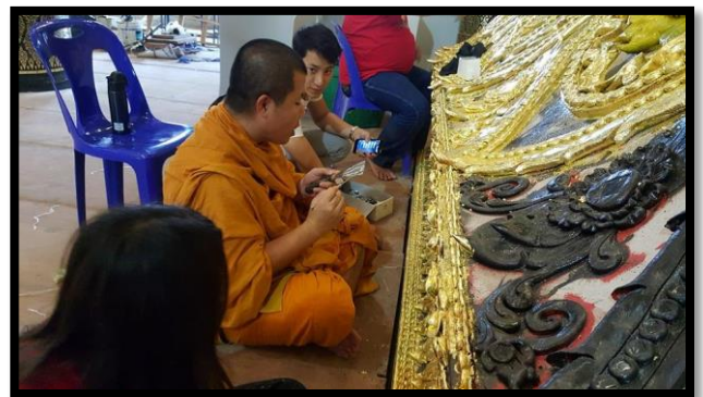
(พระญาณวิกรมขณะปฏิบัติศาสนกิจในจริยวัตรต่าง ๆ)