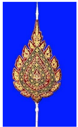
(ใบอนุโมทนาบัตร และประกาศเกียรติคุณจากหน่วยงานต่าง ๆ พร้อมทั้งลำดับพัดยศสมณศักดิ์)