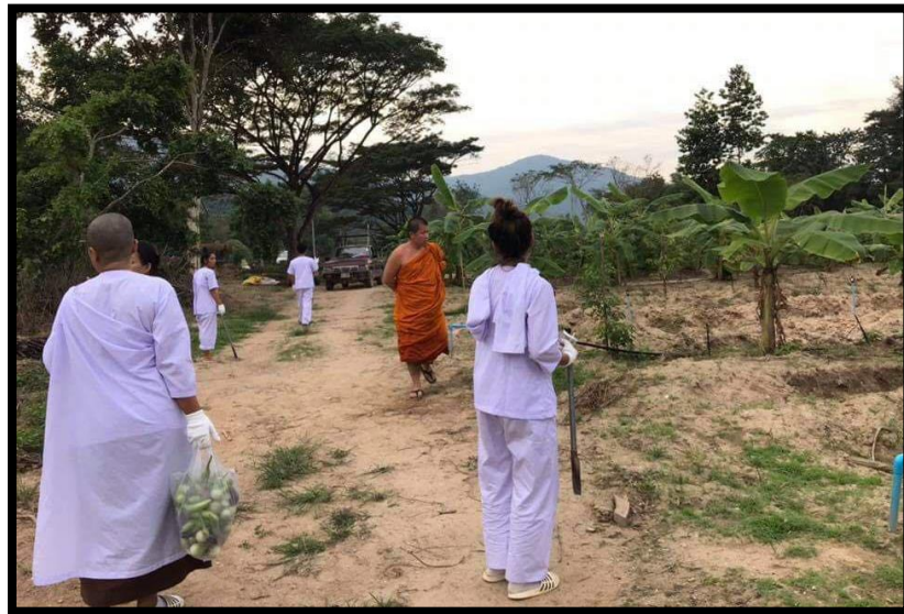
(พระญาณวิกรม น้อมนำหลักเศรษฐกิจพอเพียงมาปรับใช้ในการพัฒนาวัด และเผยแพร่สู่ญาติโยม)