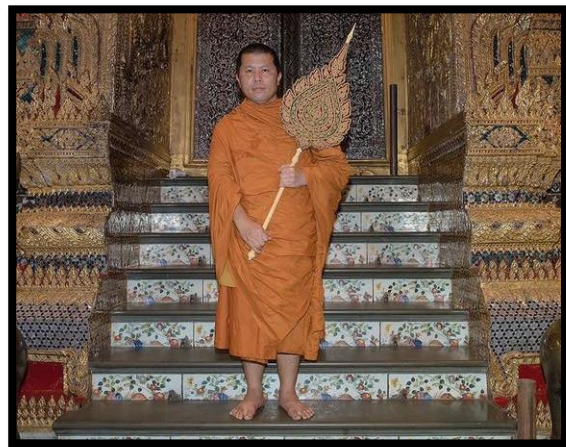
พ.ศ.๒๕๕๙ ได้รับพระราชทานแต่งตั้งเป็นพระราชาคณะชั้นสามัญ ที่ พระญาณวิกรม (สย.)