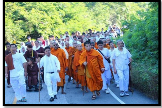
(พระญาณวิกรมขณะปฏิบัติศาสนกิจในจริยวัตรต่าง ๆ)