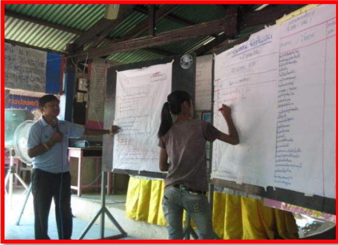
สรุปแนวทาง เพื่อการพัฒนาหมู่บ้าน