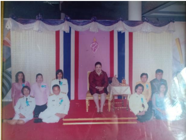
เข้าเฝ้า พระเจ้าวรวงศ์เธอพระองค์เจ้าโสมสวลี กรมหมื่นสุทธนารีนาถ รับเหรียญรางวัล ตามโครงการเพื่อนพึ่งพายามยาก