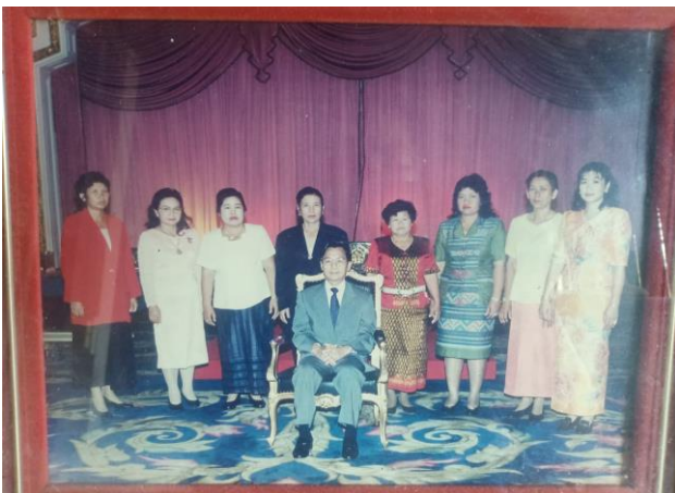
ผู้นำสตรีเขตแปดจังหวัดภาคเหนือ เข้าพบนายกรัฐมนตรี