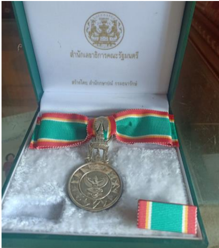
รับพระราชทานเครื่องราชอิสริยาภรณ์