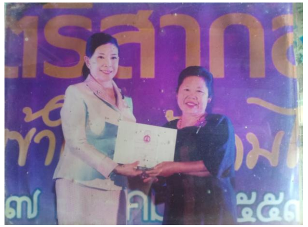
รับรางวัลสตรีดีเด่น ๑๗ จังหวัดภาคเหนือ