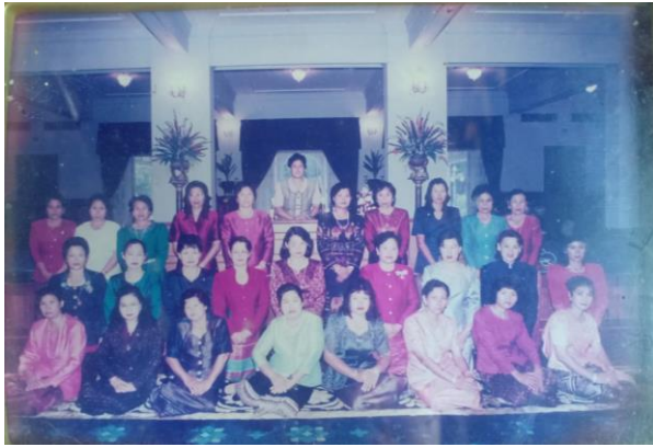
เป็นตัวแทนสตรี ระดับภูมิภาคเข้าสมเด็จพะเทพรัตนราชสุดาฯ สยามบรมราชกุมารีรัตนราชสุดา