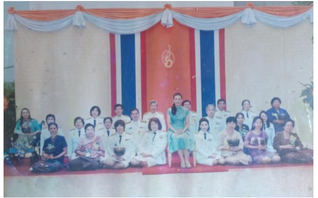
รับรางวัล สิ่งแวดล้อมโลก