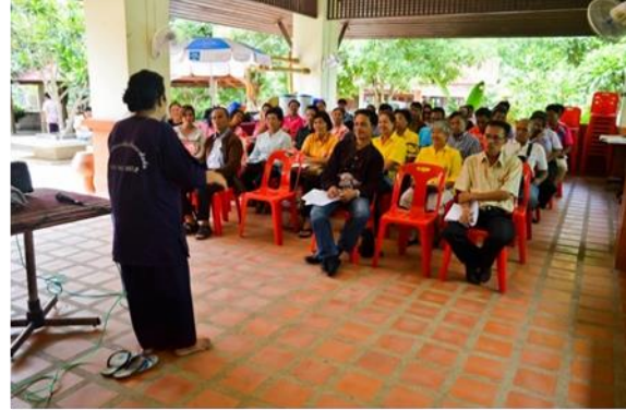
ภาพตัวอย่างการทำหน้าที่วิทยากรบรรยายให้ความรู้ ให้แก่คณะศึกษาดูงาน