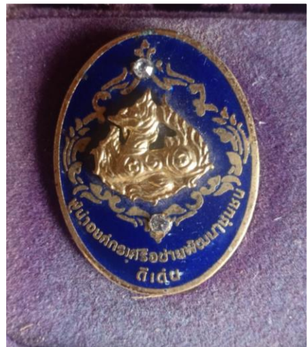
รับรางวัลผู้นำองค์กรเครือข่ายพัฒนาชุมชนดีเด่น