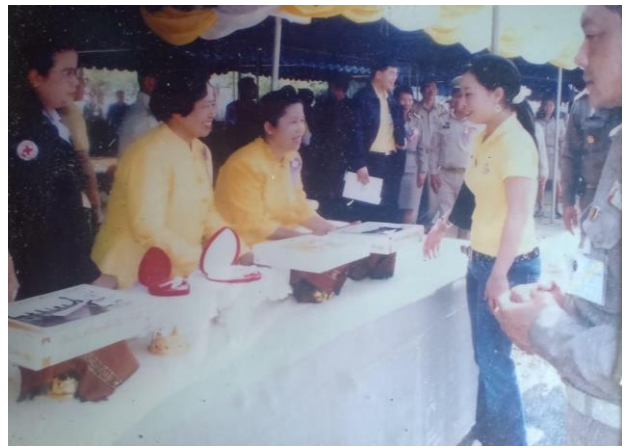
เข้าเฝ้า พระองค์ภาฯ เสด็จเยี่ยมประชาชน ประสบอุทกภัย น้ำท่วม ตำบลบ้านตึก