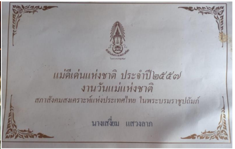
รับรางวัลแม่ดีเด่นแห่งชาติ ประจำปี ๒๕๕๗