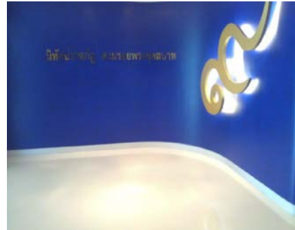
หอเฉลิมพระเกียรติ “นิตศน์ราชกัณ”