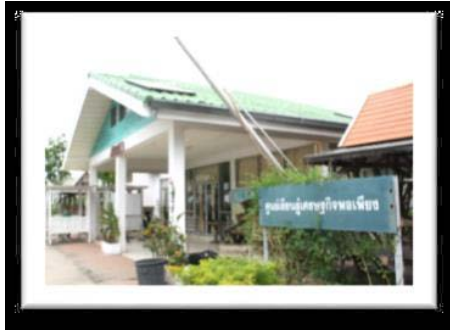
ศูนย์เรียนรู้เศรษฐกิจพอเพียง