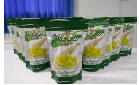
บรรจุภัณฑ์ใหม่ได้รับการพัฒนาจากอุตสาหกรรมจังหวัดสระแก้ว