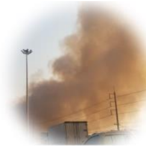
ปัญหามลพิษทางอากาศ