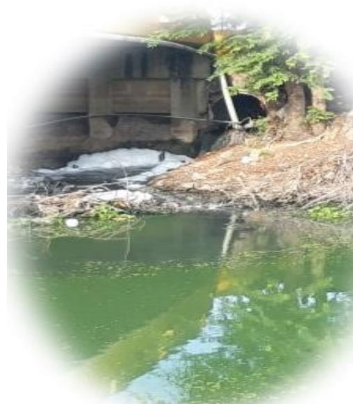
ปัญหาน้ำเสียชุมชน