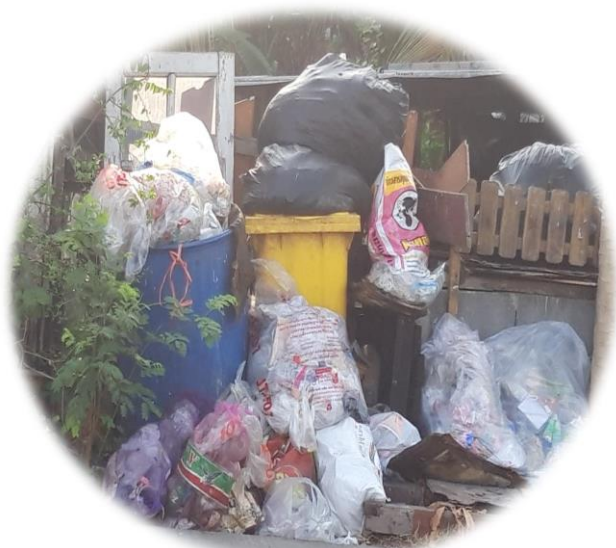
ปัญหาขยะมูลฝอย

วิเคราะห์เป้าหมายในยุทธศาสตร์ชาติและเรื่องที่มีการร้องเรียนจาก ประชาชน ด้านการจัดการสิ่งแวดล้อม