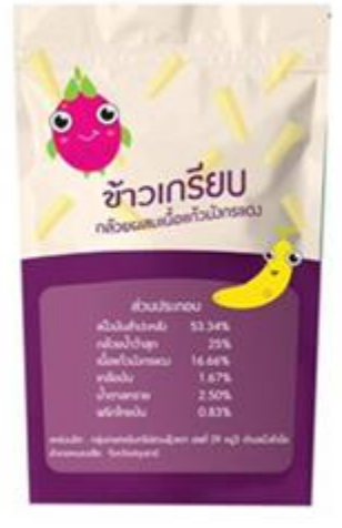
ผู้ประกอบการเลือกแบบที่ 1