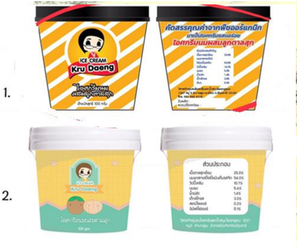
ผู้ประกอบการเลือกแบบที่ 1