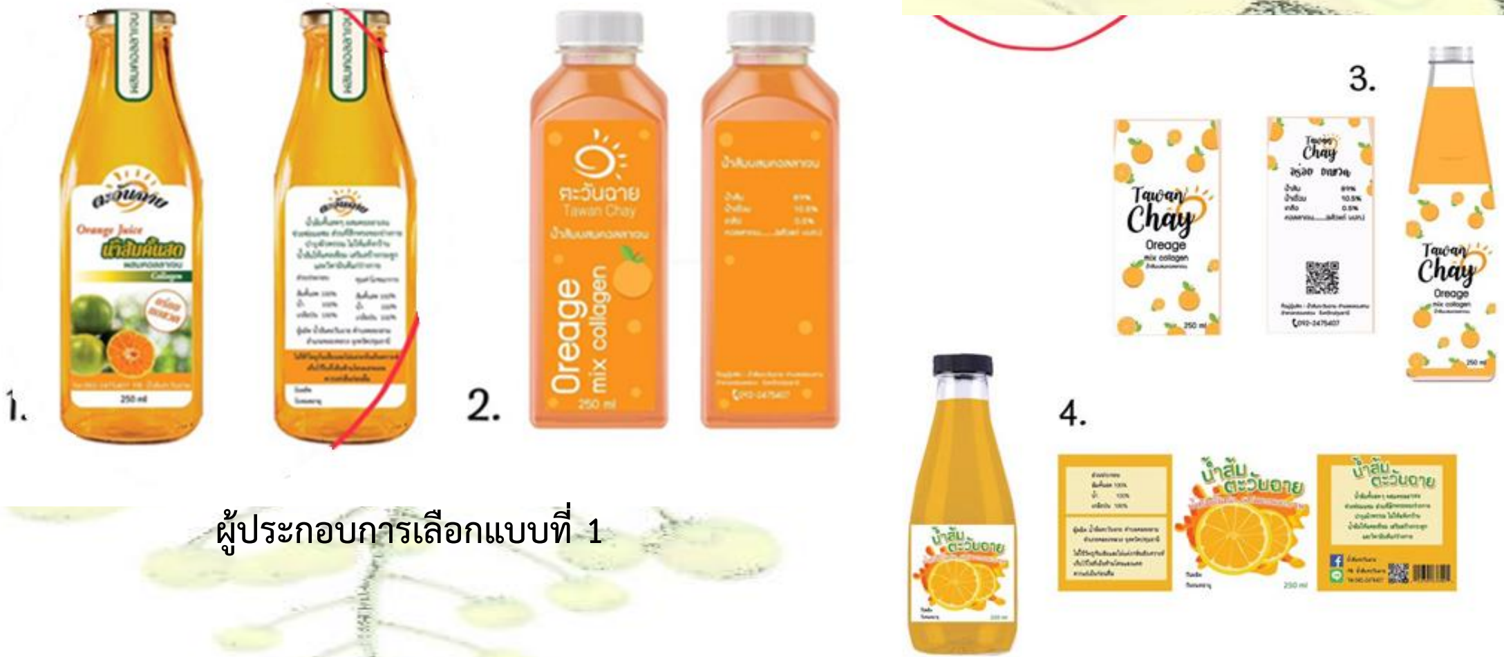
ผู้ประกอบการเลือกแบบที่ 1