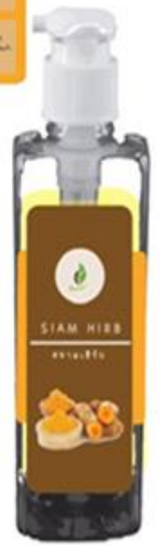
ผู้ประกอบการเลือกแบบที่ 3