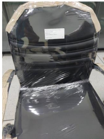
ภาพประกอบ อุปกรณ์ที่มีให้ใช้งาน