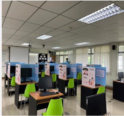
เครื่องคอมพิวเตอร์