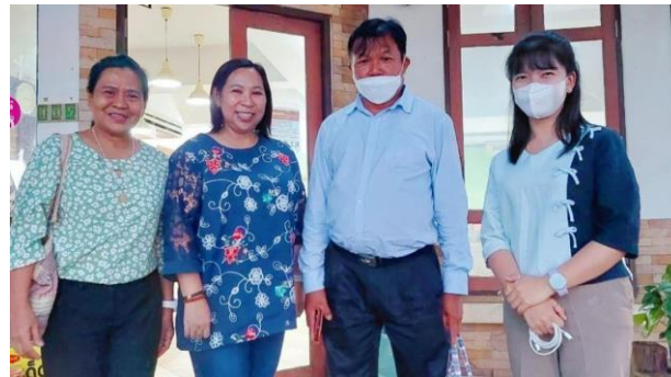
มะขามวังทอง