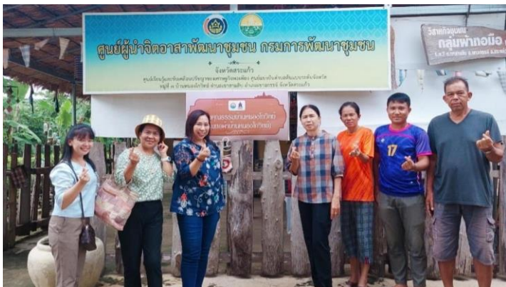
กระเป๋าร้านผ้าทอมือ