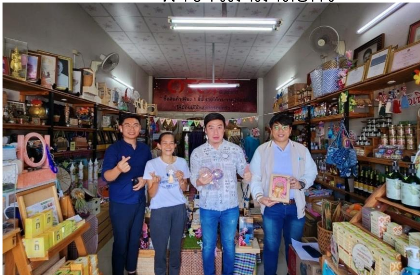
ผ้าขาวม้ามาลัยกร