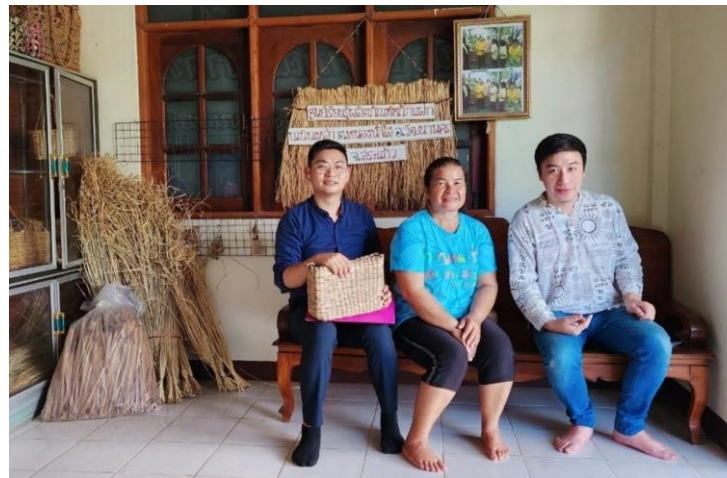
ตะกร้าผักตบชวา