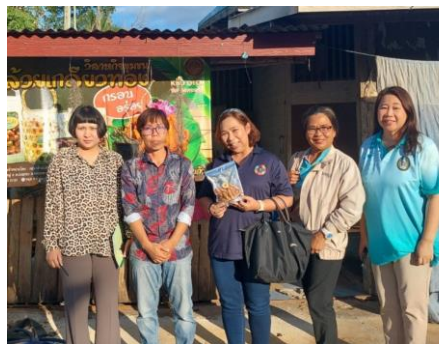
วิสาหกิจชุมชนกล้วย เกลียวทอง ต. เบญจขร อ.คลองหาด จ.สระแก้ว