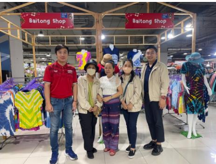
กลุ่มผ้ามัดย้อม ต. คุคต อ. ลำลูกกา จ. ปทุมธานี