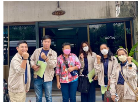
หัตถกรรมบ้านลูกบัตทราว ดีหินสี่หยก ต.เมือง อ.เมือง จ.สระแก้ว