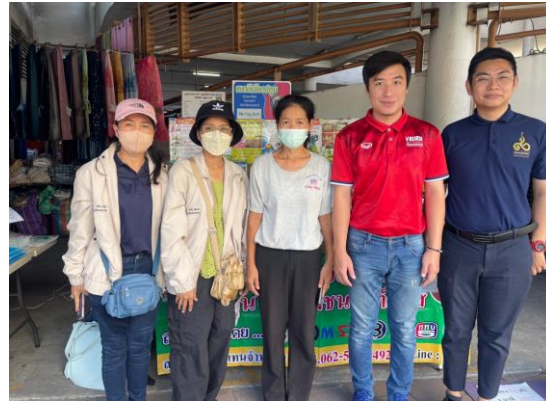
กลุ่มวิสาหกิจชุมชน สมุนไพร (ที่ไม่ใช่ อาหาร) สบู่มะขาม น้ำผึ้ง ต. คลองหนึ่ง อ. คลองหลวง จ. ปทุมธานี