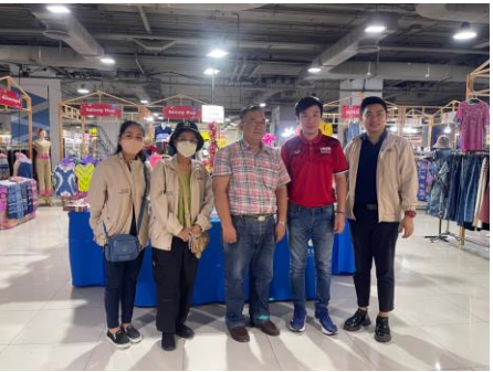
กลุ่มคูกี้เบเกอรี่ ต. คุคต อ. ลำลูกกา จ. ปทุมธานี