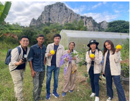
สวนนายโณู เขาฉกรรจ์ ต. เขาฉกรรจ์ อ. เขาฉกรรจ์ จ.สระแก้ว