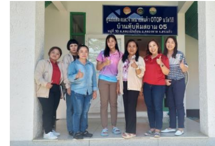
วิสาหกิจชุมชนกลุ่มแปรรูป สมุนไพรทับทิมสยาม 05 ต.คลองไก่อีئون อ.คลองหาด จ.สระแก้ว