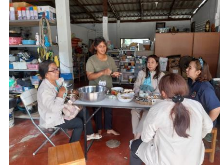
วิสาหกิจชุมชนไข่เค็มผู้พัน ต.วังน้ำเย็น อ.วังน้ำเย็น จ.สระแก้ว