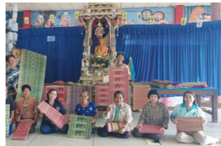
องค์กรสวัสดิการชุมชน ตำบลทุ่งมหาเจริญ ต.ทุ่งมหาเจริญ อ.วังน้ำเย็น จ.สระแก้ว