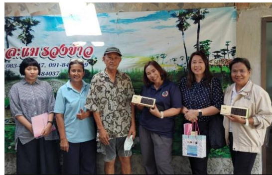
วิสาหกิจชุมชนรวง ข้าว ต. คุบางหลวง อ. ลาดหลุมแก้ว จ. ปทุมธานี

ลงพื้นที่สำรวจเก็บข้อมูล จังหวัดปทุมธานี ๓ อำเภอ ได้แก่ อ.ลาดหลุมแก้ว, อ.ลำลูกกา, และ อ.คลองหลวง ๕ ตำบล ได้แก่ ต. คุคต , ต.ลาดสวาย, ต.คลองหลวง, ต.คุขวาง,และ ต.คุบางหลวง ผู้ประกอบการไม่ตอบรับ ๑. อาหารปลาตุกแดดเดียว ต. หนองสามวัง อ. หนองเสือ จ. ปทุมธานี ๒. อาหารเค็กรุ่น ต. หน้าไม้ อ. ลาดหลุมแก้ว จ. ปทุมธานี