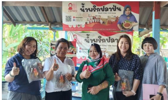
กลุ่มสัมมาชีพแปรรูป ปลา ต. คุขวาง อ. ลาดหลุมแก้ว จ. ปทุมธานี