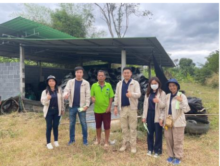
กลุ่มถ่านอัดแท่ง ต.ท่าเกษม อ.เมือง จ.สระแก้ว