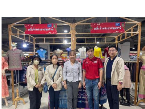
กลุ่มผ้าทอมณี เจ้าพระยาปทุมธานี ต. ลาดสวาย อ. ลำลูกกา จ. ปทุมธานี