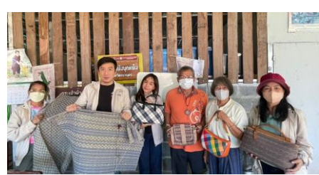
กลุ่มเครื่องหนังบุญเพ็ง ต.โนนหมากเค็ง อ.วัฒนานคร จ.สระแก้ว