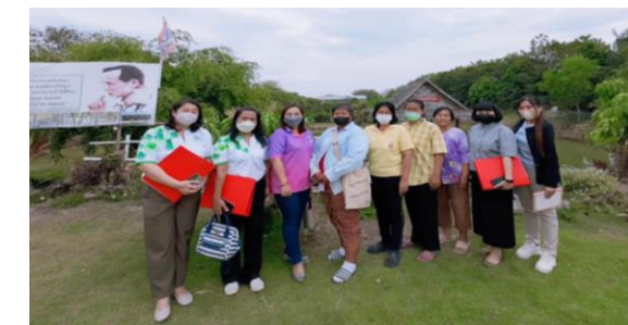
วิสาหกิจชุมชนสตรีก้าวหน้าสมุนไพร ต.คลองหก อ.คลองหลวง จ.ปทุมธานี

9 ตำบล ได้แก่ ต. รังสิต ,ต.นพรัตน์, ต.บางกระบือ, ต.บึงนาราง,ต.คลองควาย ,ต.บางเตย, ต.คลองหก, ต.คลองเจ็ด และ ต.คลองหลวง