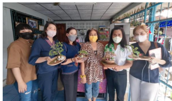
วิสาหกิจแสงตะวัน ธัญบุรี บ้านเรือนไทยจำลอง ต.รังสิต อ.ธัญบุรี จ.ปทุมธานี

ลงพื้นที่สำรวจเก็บข้อมูล จังหวัดปทุมธานี 4 อำเภอ ได้แก่ อ.ธัญบุรี, อ.หนองเสือ, อ.สามโคก, และ อ.คลองหลวง