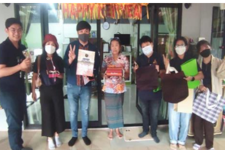
วิสาหกิจชุมชนผ้าซิ่นงามหันทราย ต.หันทราย อ.อรัญประเทศ จ.สระแก้ว