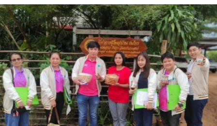
วิสาหกิจชุมชนกลุ่มเลี้ยงไหมออร์และแปรรูปผลิตภัณฑ์จากไหมออร์ ต.ทัพเสด็จ อ.ตาพระยา จ.สระแก้ว