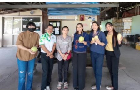
วิสาหกิจชุมชนกลุ่มผลิตไม้ผลเมืองธัญบุรี มะม่วงน้ำดอกไม้ ต.บึงนาราง อ.ธัญบุรี จ. ปทุมธานี

ลงพื้นที่สำรวจเก็บข้อมูล จังหวัดปทุมธานี 4 อำเภอ ได้แก่ อ.ธัญบุรี, อ.หนองเสือ, อ.สามโคก, และ อ.คลองหลวง