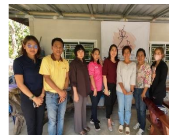
วิสาหกิจชุมชนสุขภาพดี ชีวีมีสุข ต.สระแก้ว อ.เมืองสระแก้ว จ.สระแก้ว