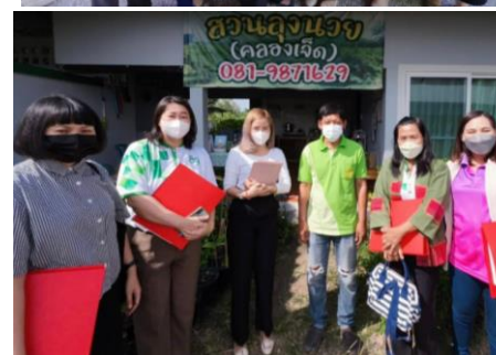
กลุ่มผู้ผลิตสบู่ฟักข้าว ต.คลองหลวง อ.คลองหลวง จ.ปทุมธานี