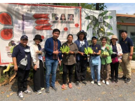
กลุ่มวิสาหกิจชุมชนกล้วยปทุมรัตน์ ม 2 ต.นพรัตน์ อ.หนองเสือ จ.ปทุมธานี.