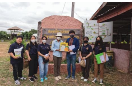
วิสาหกิจชุมชนเกษตรผสมผสานเพื่อความยั่งยืน “ไร่ ณ ชายแดน” ต.ทับพริก อ.อรัญประเทศ จ.สระแก้ว