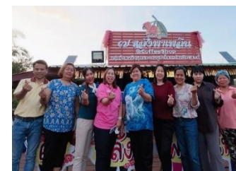
วิสาหกิจชุมชนบ้านเจ็ดหลังพาเพลิน ต.โคกปี่ฆ้อง อ.เมืองสระแก้ว จ.สระแก้ว