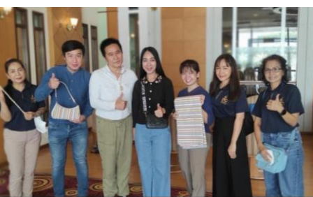
วิสาหกิจชุมชนเส้นใยบัว วัดโบสถ์ ต.บางกระบือ อ. สามโคก จ. ปทุมธานี