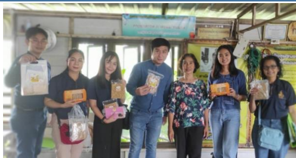
กลุ่มวิสาหกิจชุมชนทำขนมไทย กระจยา สารท ต.คลองควาย อ.สามโคก จังหวัดปทุมธานี