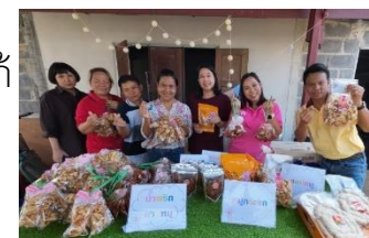
วิสาหกิจชุมชนหมูกระจกบ้านวังยาว ต.คลองหินปูน อ.วังน้ำเย็น จ.สระแก้ว