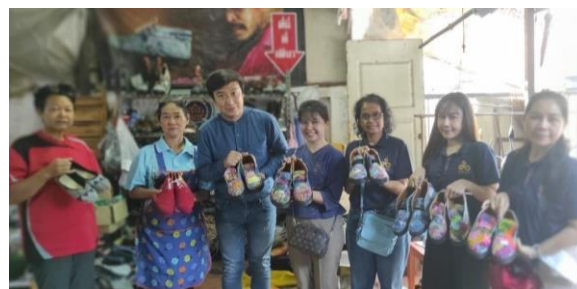
กลุ่มสัมมาชีพสามวัยร่วมใจสามัคคี รongเท้าจากกางเกงยีนส์ ต.บางเตย อ.สามโคก จ.ปทุมธานี