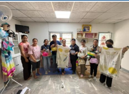
วิสาหกิจชุมชนกลุ่มงานประดิษฐ์บ้านพรพิมาน ต. รังสิต อ.ธัญบุรี จ.ปทุมธานี