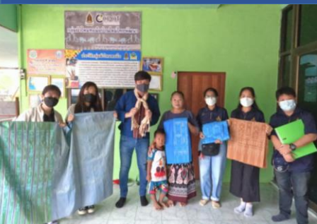
วิสาหกิจชุมชนผลิตภัณฑ์หม่อนไหมบ้านใหม่ไทยพัฒนา ต.หนองตะเคียนบอน อ.วัฒนานคร จ.สระแก้ว