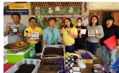
วิสาหกิจชุมชนจีเบอร์รี่หม่อนเพื่อสุขภาพ ต.วังทอง อ.วังสมบูรณ์ จ.สระแก้ว