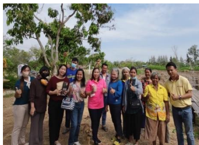
วิสาหกิจชุมชนคุ่มเพชรโกโก้ ต.คลองหินปูน อ.วังน้ำเย็น จ.สระแก้ว