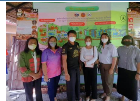
ศูนย์เรียนรู้สัมมาชีพชุมชนตำบลคลองหก ต.คลองเจ็ด อ.คลองหลวง จ.ปทุมธานี