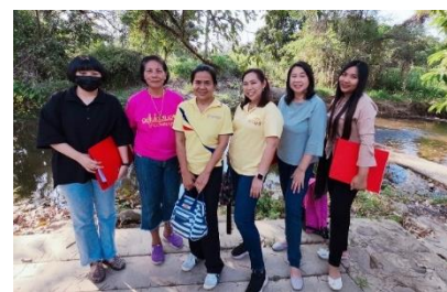
วิสาหกิจชุมชนกลุ่มแปรรูปพืชเศรษฐกิจไร่ดุดจตะวันตก ต.วังทอง อ.วังสมบูรณ์ จ.สระแก้ว