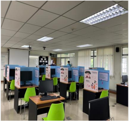
เครื่องคอมพิวเตอร์

ดำเนินการจัดเตรียมสถานที่ อุปกรณ์ และยื่นใบสมัครเสร็จเรียบร้อยแล้ว รอการตอบรับจากทาง ICDL ประเทศไทย