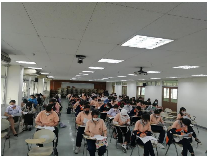
Preparation for VRU-TEP (คณะสาธารณสุขศาสตร์)