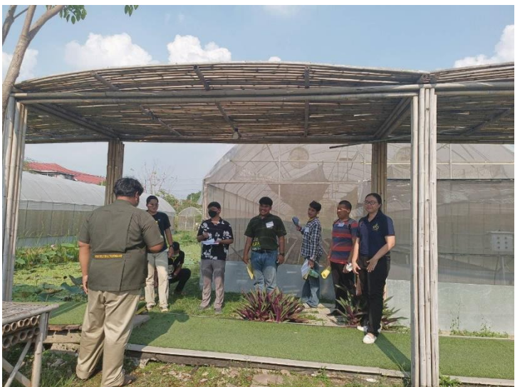
English for Agro Tour Guides (คณะเทคโนโลยีเกษตร)