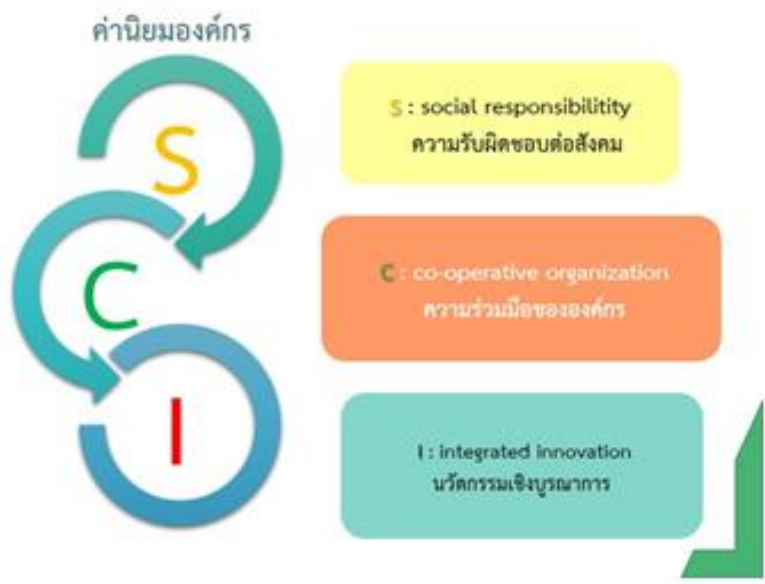
แผนภาพแสดงวิสัยทัศน์และค่านิยมของคณะวิทยาศาสตร์และเทคโนโลยี