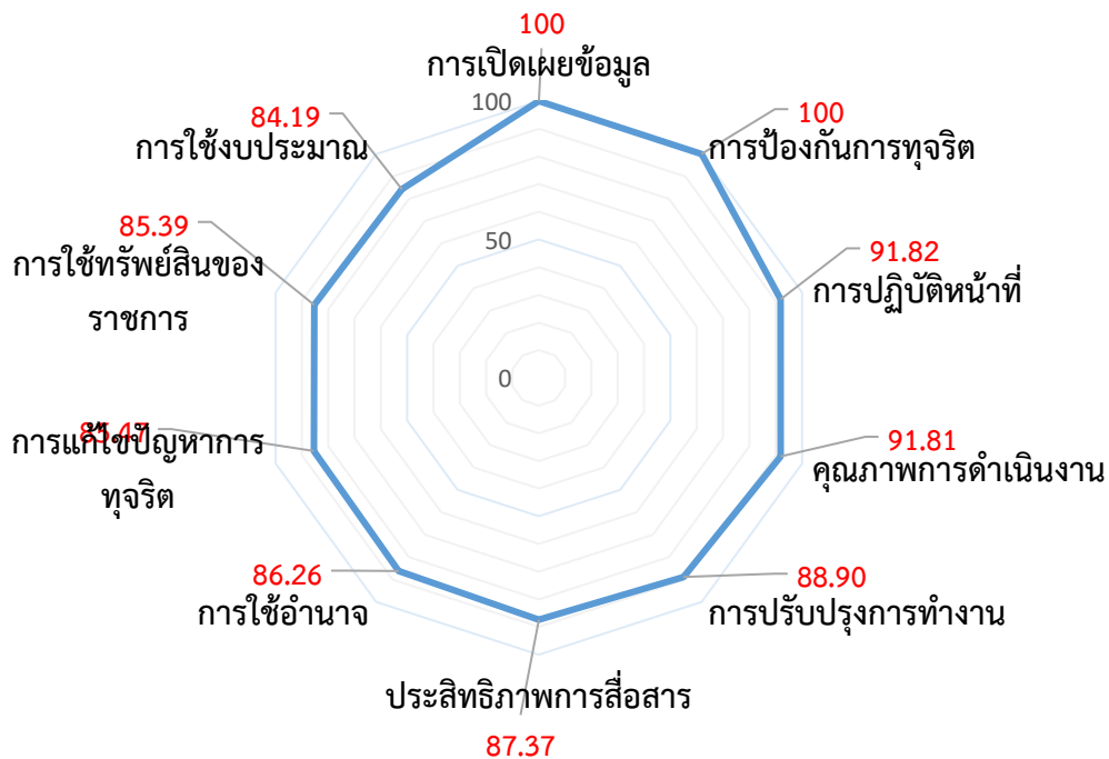
รูปที่ ๑ ภาพแสดงผลคะแนนการประเมิน ด้วยรูปแบบใยแมงมุม