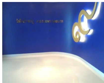
หอเฉลิมพระเกียรติ “นิทัศน์ราชภัฏ”