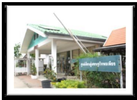
ศูนย์เรียนรู้เศรษฐกิจพอเพียง

จุดประสงค์การพัฒนาศูนย์การเรียนรู้ของสำนักส่งเสริมการเรียนรู้และบริการวิชาการ เพื่อให้ นักศึกษา อาจารย์ บุคลากร และประชาชนทั่วไป สามารถเข้ามาศึกษาหาความรู้ เพิ่มพูนทักษะด้านต่างๆ จากการปฏิบัติจริงนอกห้องเรียน แลกเปลี่ยนประสบการณ์ ในการแก้ไขปัญหาชุมชนท้องถิ่น เป็นแหล่งรวบรวมองค์ความรู้ ในการถ่ายทอด เผยแพร่ ให้กับผู้เข้ามาศึกษาดูงาน สามารถนำกลับไปใช้ในแก้ปัญหาของชุมชนได้อย่างแท้จริง